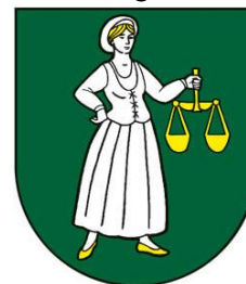
Obrázok 2 Erb obce

Erb obce Zemplínske Jastrabie tvorí v zelenom štíte strieborná zlatovlasá zlatootúť žena v striebornom klobúku, pravicou vbok, v ľavici so zlatými váhami.